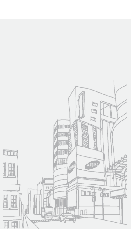
Erabiltzailearen eskuliburua, Samsung G1100.