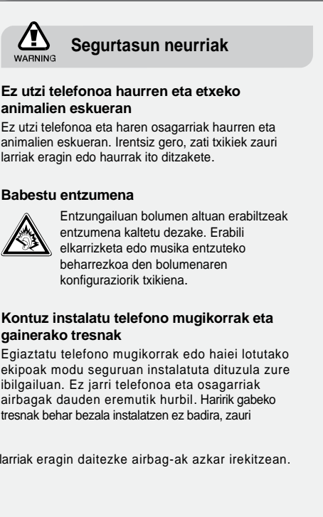
Erabiltzailearen eskuliburua, Samsung G1100.

Erabilerari eta segurtasunari buruzko informazioa Kontuan eduki ohar hauek egoera arriskutsuak edo ilegalak saihesteko eta telefono mugikorraren errendimendua hobea izan dadin bermatzeko.